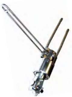
Option FAW I-A Fallwirbel 2:1 mit Rolle und Abweiser (Taufall bis 6 mm, Drahtfall bis 4 mm)