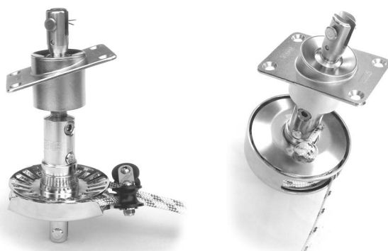
Spiere unten Rohr 25x2,5